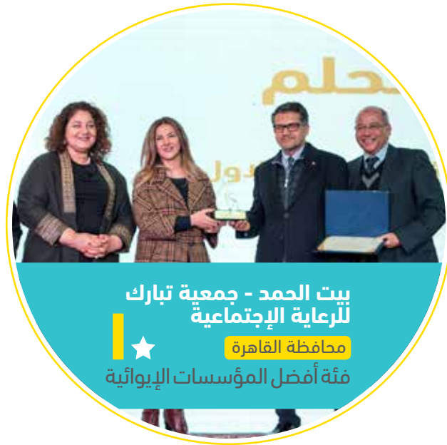
بيت الحمد - جمعية تبارك ★ محافظة القاهرة فئة أفضل المؤسسات الإيوائية