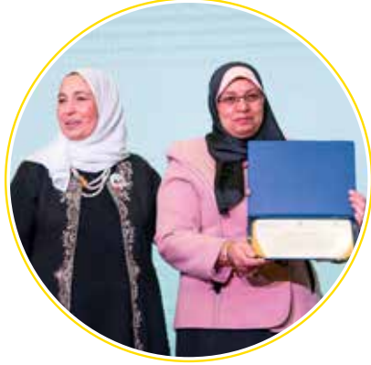
مديرية وزارة التضامن - الدقهلية لتشجيعها للمؤسسات التابعة لها على المشاركة في الجائزة.