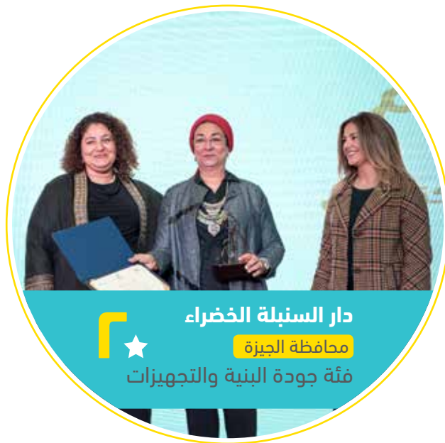
دار السنبله الخضراء ★ محافظة الجيزة فئة جودة البنية والتجهيزات