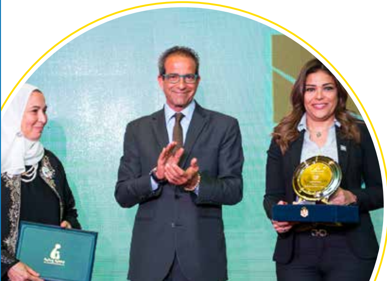
المسؤولية الاجتماعية لشركة إعمار مصر توجيه الدعم المادي والعيني لمساعدة المؤسسات على تطبيق معايير جودة الرعاية.