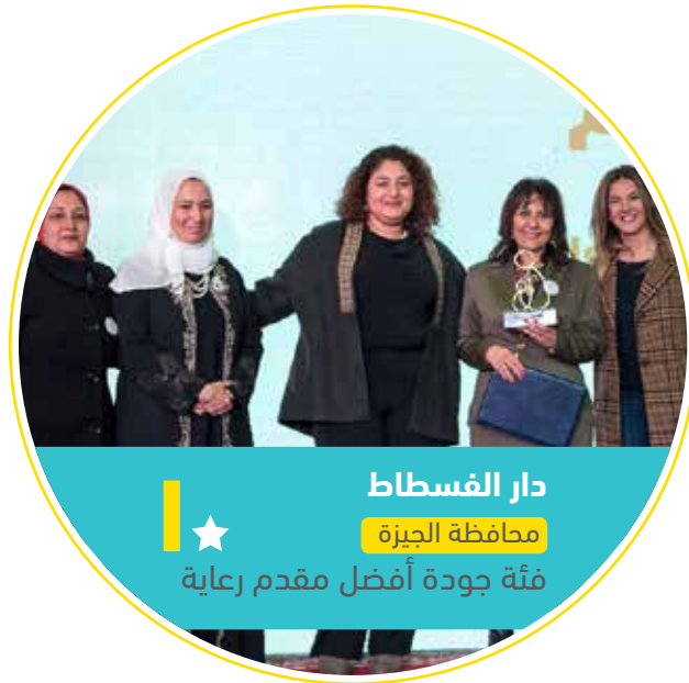
دار الفسطاط ★ محافظة الجيزة فئة جودة أفضل مقدم رعاية