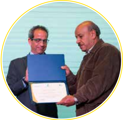
مديرية وزارة التضامن - المنيا لتشجيعها للمؤسسات التابعة لها على المشاركة في الجائزة.