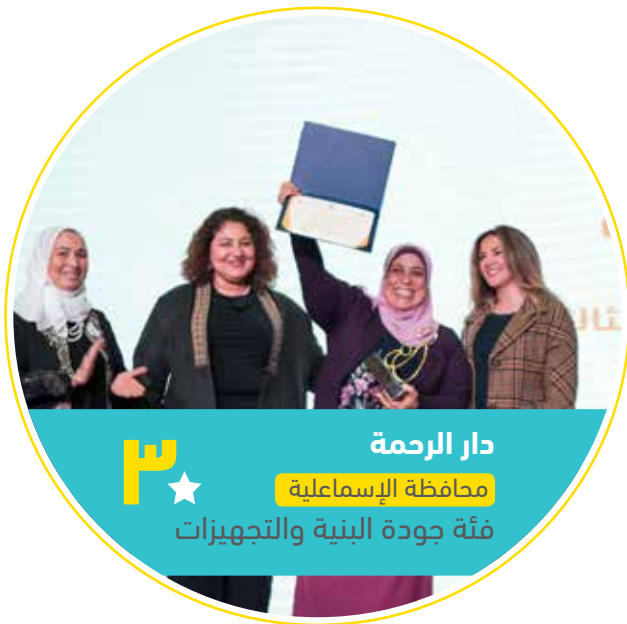
دار الرحمة ★ محافظة الإسماعيلية فئة جودة البنية والتجهيزات