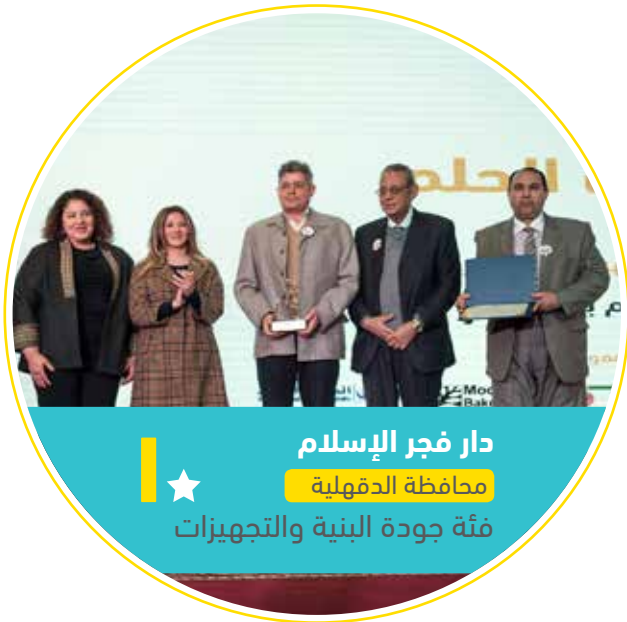
دار فجر الإسلام ★ محافظة الدقهلية فئة جودة البنية والتجهيزات